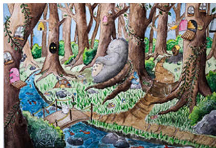
STUDENT ART, AGE 13